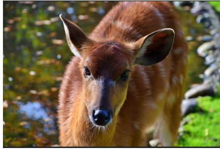
vom Naturzoo Rheine

immer, gehen dann weitere Anmeldungen auf eine Warteliste. Bei Interesse bitte auf die Webseite schauen.