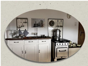
Kochküche einer Hagerer Familie